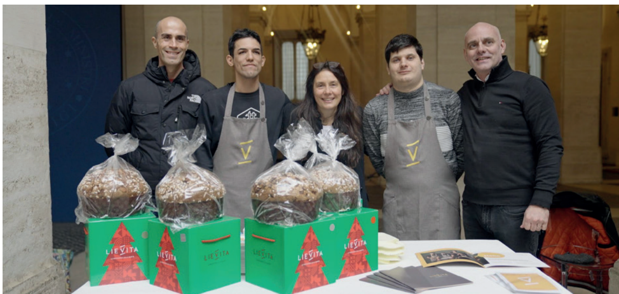
Il ministro Locatelli con i ragazzi bresciani di Pasticceria LieVita

zioni coinvolte nella presentazione dei prodotti che realizzano attraverso percorsi di inclusione lavorativa: Sala da Tè, Bistrottino, Il Brugo, Liberautismo, Noi Genitori, Fondazione Opera Sacra Famiglia, Rurabilandia, La Bella Sfilza, Gruppo L'Impronta, Pasticceria LieVita, Fricchiò, Agricoltura Nuova. Ad aprire l'iniziativa, la musica dell'orchestra inclusiva Allegro Moderato che successivamente si è esibita nell'Inno di Mameli. Il flash mob, realizzato dagli oltre 120 atleti di Special Olympics Italia, ha animato Palazzo Chigi prima della proiezione sulla facciata della scrit-