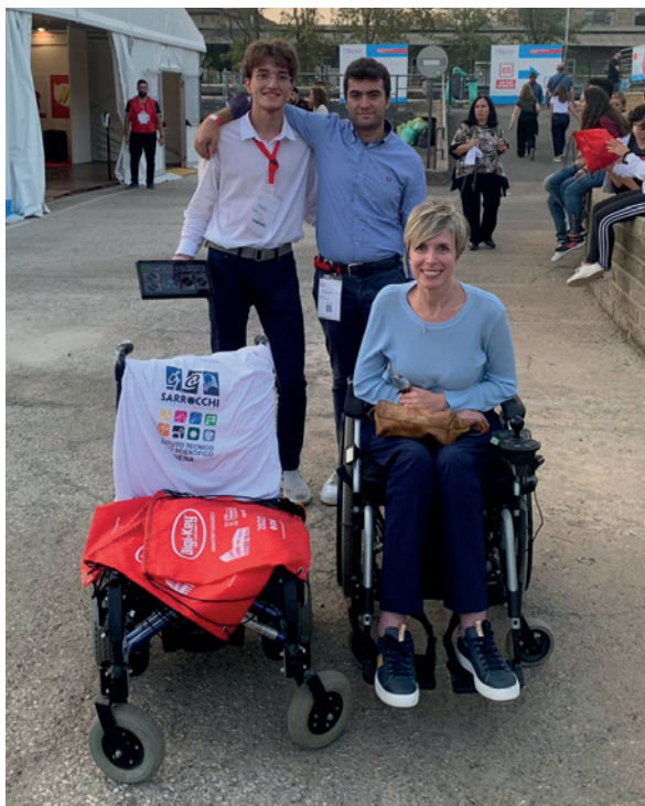
Rappresentanti del Sarrocchi al Maker Faire

bolico testimone di un'inclusione tecnologica e intelligente.