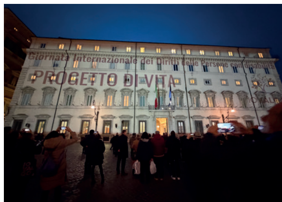
La facciata di Palazzo Chigi illuminata per la Giornata