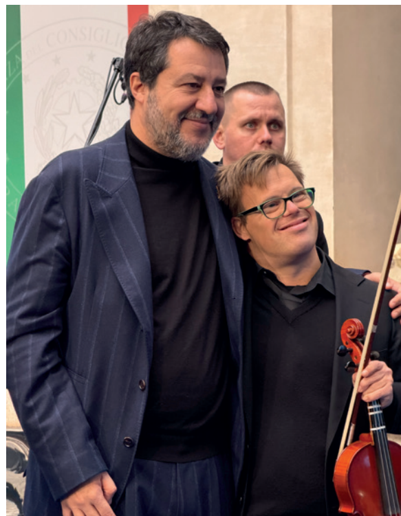
Il vice premier Salvini con il violinista Jacopo Wiquel di Allegro Moderato

intervenuto portando anche il saluto del presidente del Consiglio, Giorgia Meloni: "Ogni persona in qualsiasi condizione, anche quando ha gravi disabilità, ha in sé un tesoro di inestimabile valore che è prezioso per l'intera comunità. E questa è la convinzione che ci rende civili. Quando questa certezza viene meno, vacillano le fondamenta su cui abbiamo costruito la nostra civiltà. L'attenzione del governo su