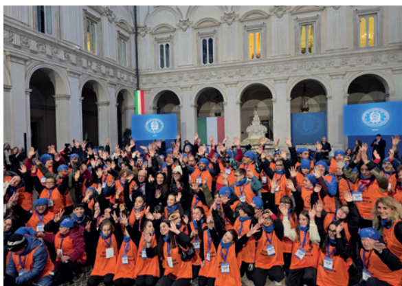
Il flash mob degli atleti di Special Olympics nel cortile di Palazzo Chigi

Il sottosegretario di Stato alla presidenza del Consiglio dei Ministri, Alfredo Mantovano è