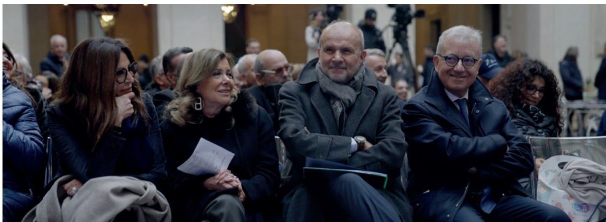
Da sinistra i ministri Santanchè (Turismo), Casellati (Riforme istituzionali) e Schillaci (Salute) e il sottosegretario di Stato alla Presidenza del Consiglio Mantovano

ta Giornata Internazionale dei Diritti delle Persone con disabilità ; accompagnata, sulle note di Hallelujah nella versione eseguita dal gruppo musicale inclusivo Si può fare band , da parole che pongono l'attenzione sui diritti delle persone con disabilità e rappresentano – come ha sottolineato il ministro Alessandra Locatelli – un grande significato: “Questo mondo ha bisogno di attenzione al pieno diritto alla partecipazione alla vita sociale, politica, culturale e sportiva del nostro Paese: un grande sforzo da compiere tutti insieme perché cambiare si può”. ■