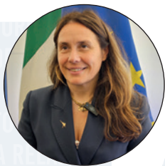
di Alessandra Locatelli Ministro per le Disabilità