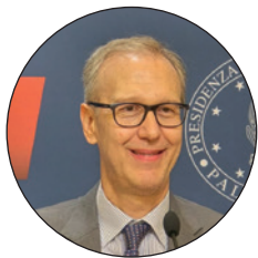
di Pier Luigi Zamporlini Consigliere per le relazioni internazionali Ministro per le Disabilità