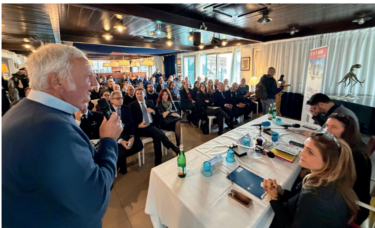
Alcuni momenti della conferenza stampa al Club Nautico di Rimini

gno di tantissime associazioni, stiamo portando avanti per promuovere uno sguardo nuovo e vedere in ogni persona le potenzialità e non i limiti”, ha sottolineato Locatelli. “C’è un mondo che ha bisogno di incontrarsi e di confrontarsi e con EXPOAID 2026 vogliamo fare ancora di più in questa direzione”, ha aggiunto il ministro annunciando poi che “ad aprile sarà presentato a Roma il programma dell’evento, che vedrà la preziosa collaborazione delle due federazioni maggiormente rappresenta-