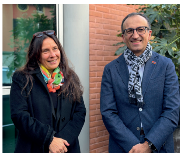
Il ministro Alessandra Locatelli e il ministro armeno Arsen Torosyan

“Il nostro Paese e il territorio lombardo ospitano realtà straordinarie che riescono davvero a fare la differenza nella vita delle persone con disabilità e delle loro famiglie – ha spiegato Locatelli –. Ho mostrato con piacere al ministro Torosyan alcuni progetti che promuovono modelli avanzati di presa in carico, inclusione e sostegno alla persona, mettendo sempre al centro la dignità della vita di ciascuno”.