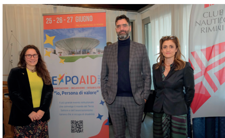
Il ministro Locatelli con Kristian Gianfreda e Francesca Raggi

“La seconda edizione di EXPOAID cresce e si rinnova grazie alla collaborazione di una rete straordinaria di associazioni e a una forte sinergia con il territorio, a partire dal Comune di Rimini e dall'Ausl Romagna. Trenta focus tematici, uno spazio dedicato agli autorappresentanti, due serate musicali aperte al pubbli-