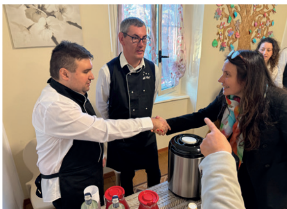
Alcuni momenti della visita ufficiale svoltasi tra Milano, Como, Cernobbio e Albiolo

promuovono percorsi formativi e professionali inclusivi. La visita si è poi spostata ad Albiolo, presso Casa Enrico e Casa di Guido di Agorà 97, comunità che accolgono giovani e adulti con disabilità intellettiva e relazionale. La due giorni si è conclusa con la partecipazione al convegno